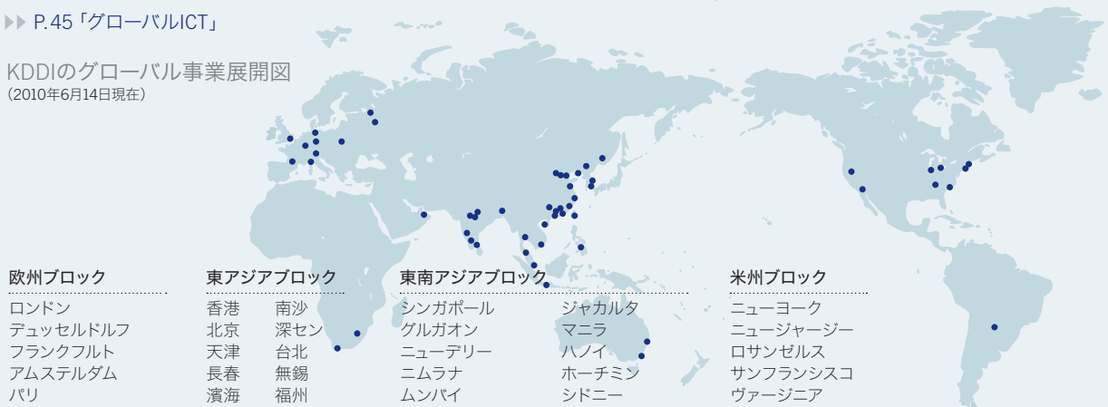
KDDIのグローバル事業展開図 (2010年6月14日現在)