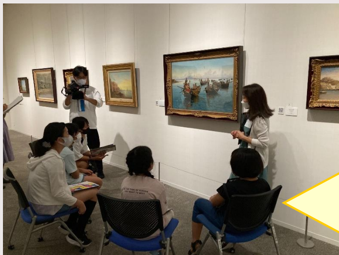
(対話型鑑賞の様子)