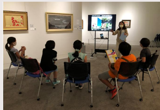
アートの「タネ」岩絵の具の成り立ちを知る