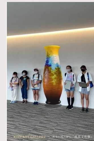
(ARガレとの記念撮影)